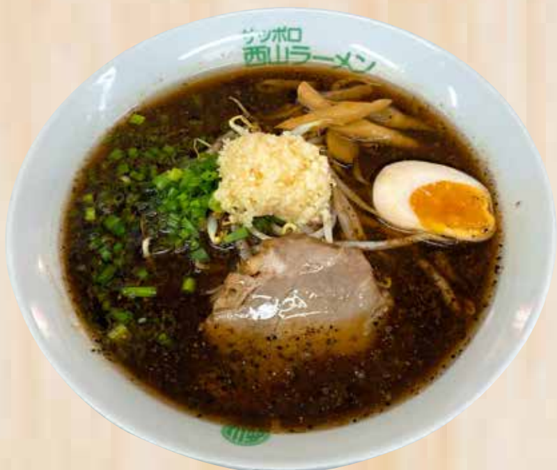
Tokusen Shoyu Black Rabel 特選醤油ブラックラベル $19.8