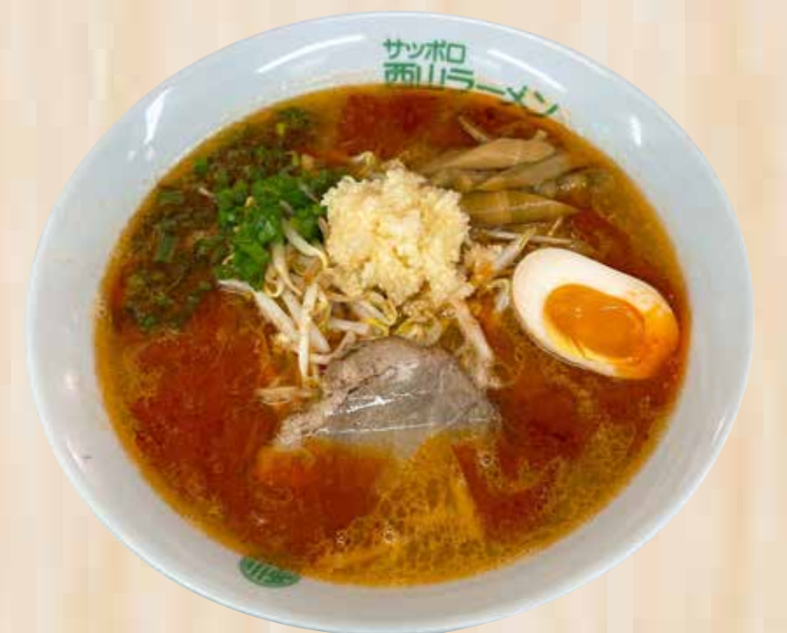
Tokusen Miso Red Rabel 特選みそレッドラベル $19.8