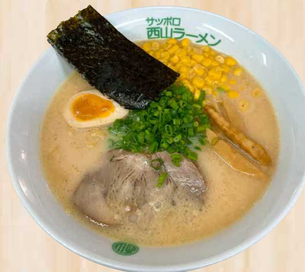
Tokusen Shio Tonkotsu 特選とん塩 $17.8