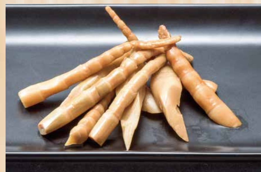
Bamboo Shoots メンマ $1.5