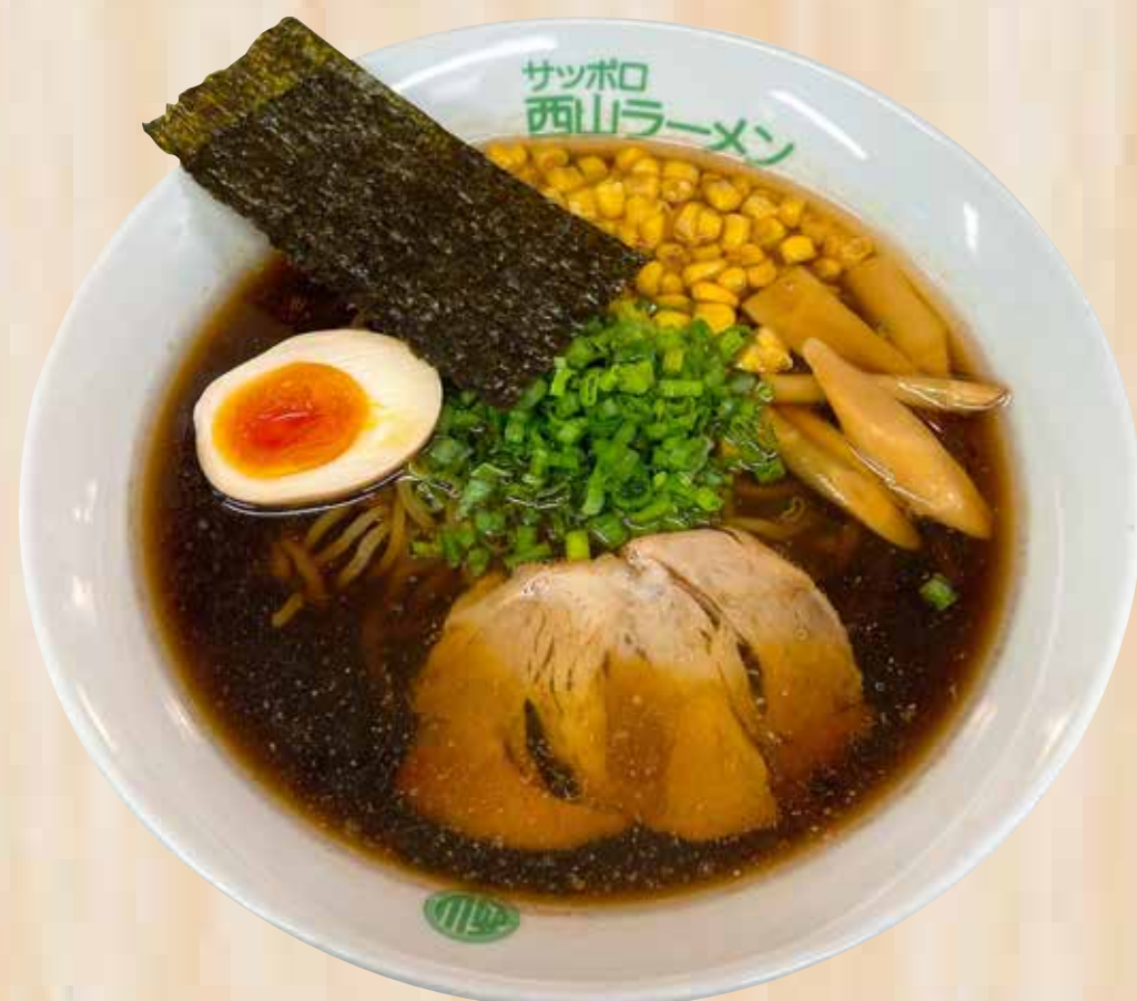
Tokusen Shoyu 特選醤油 $17.8