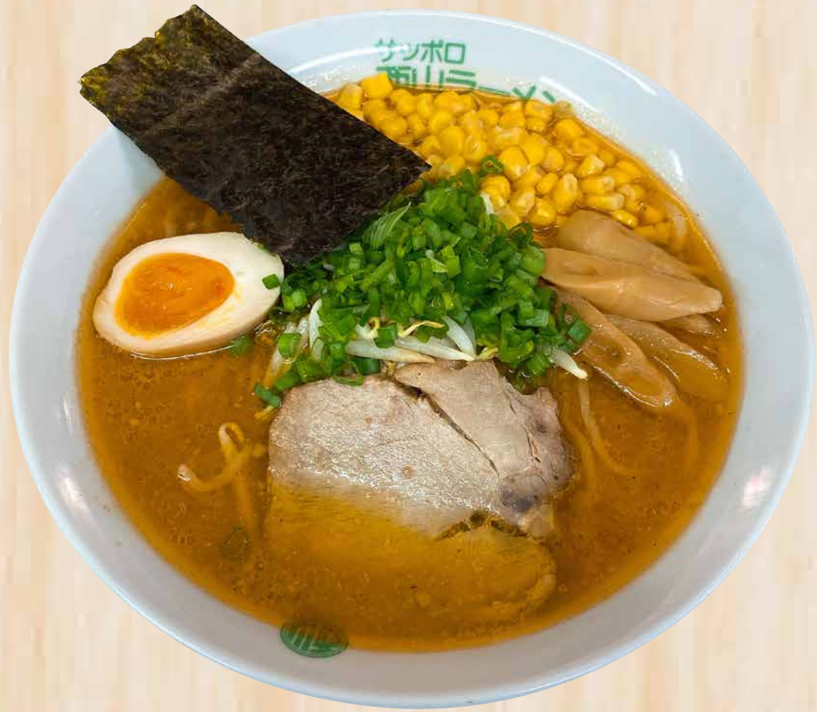
Tokusen Miso 特選みそ $17.8