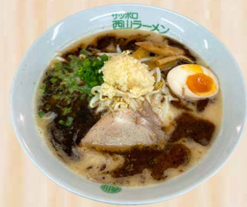
Tokusen Shio Tonkotsu Black Rabel 特選とん塩ブラックラベル $19.8