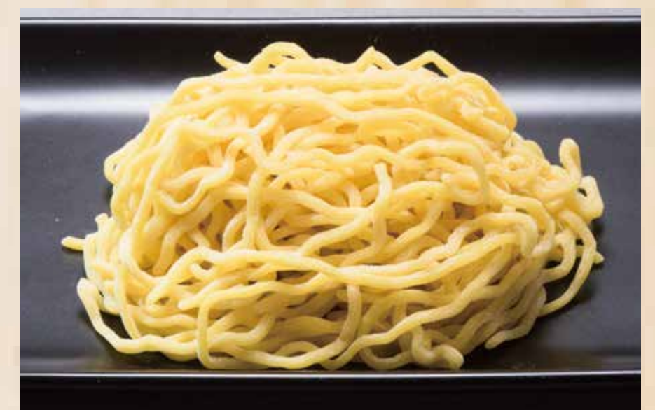
Extra Noodles(Half portion) 麺大盛り(半玉) $3.0

Images are for illustration purposes only. Actual presentation may vary.