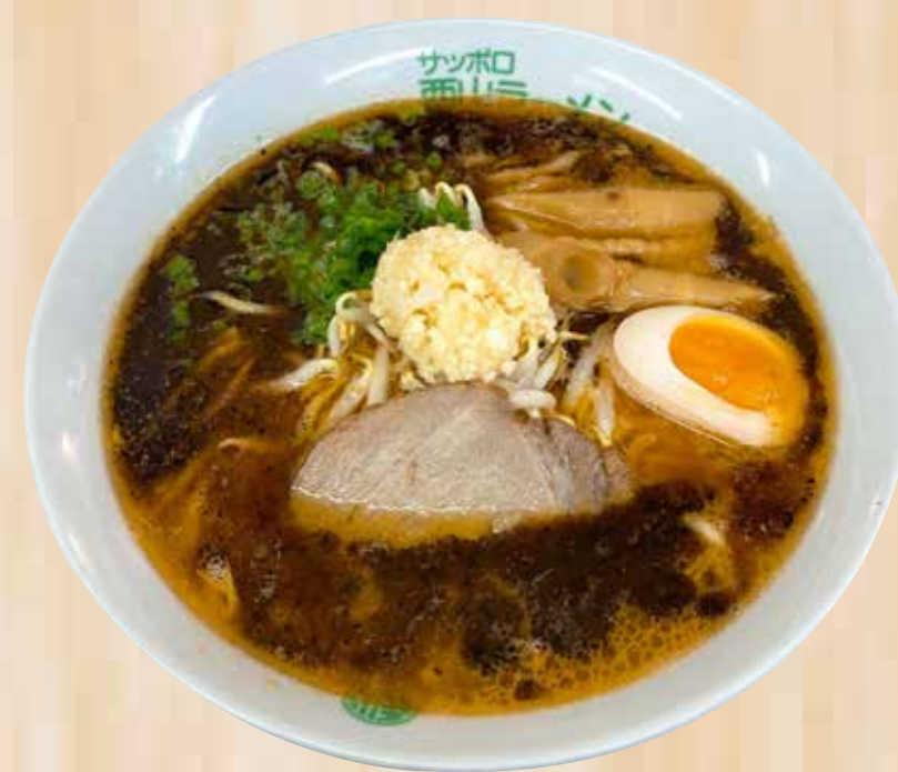
Tokusen Miso Black Rabel 特選みそブラックラベル $19.8