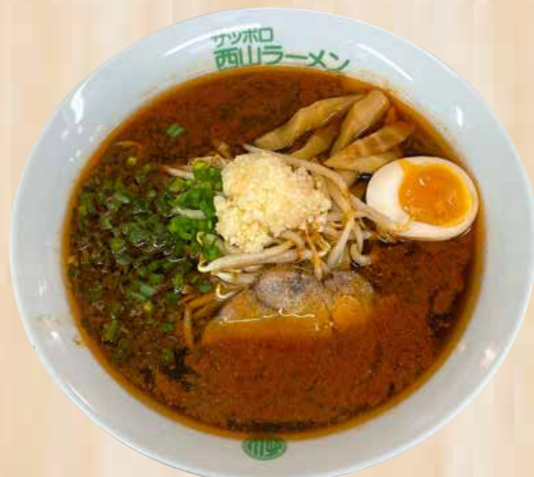
Tokusen Shoyu Red Label 特選醤油レッドラベル $19.8