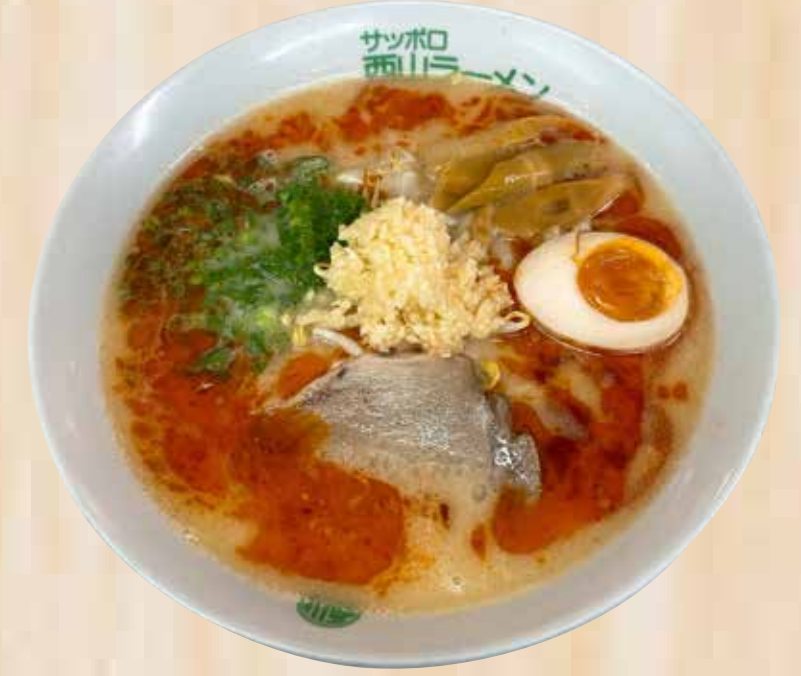
Tokusen Shio Tonkotsu Red Label 特選とん塩レッドラベル $19.8