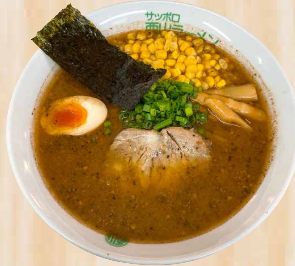
Noko Miso Tonkotsu 濃厚みそ豚骨 $17.8